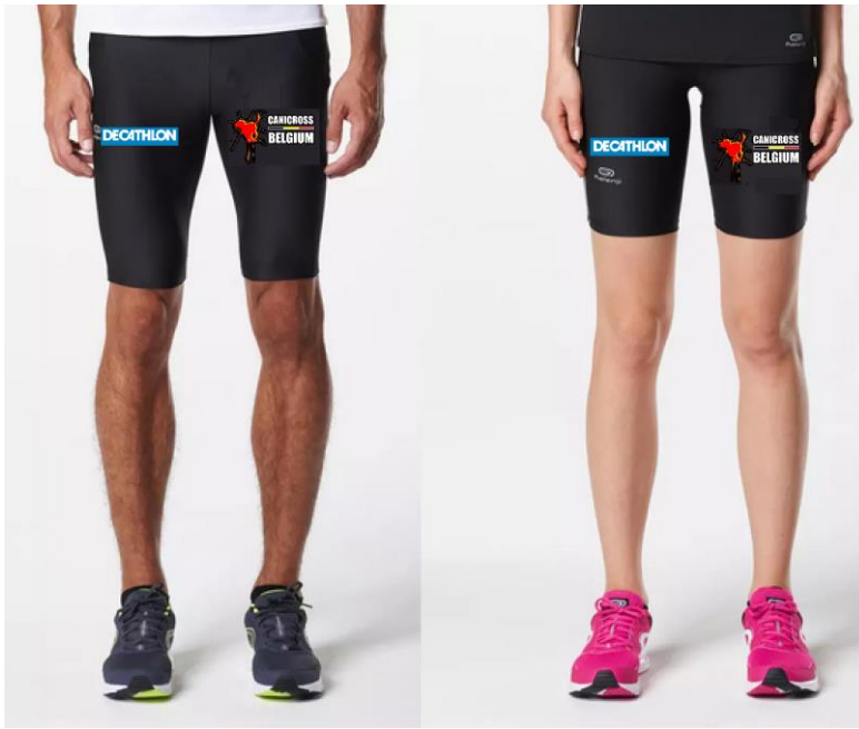
Loop short Heren-Dames